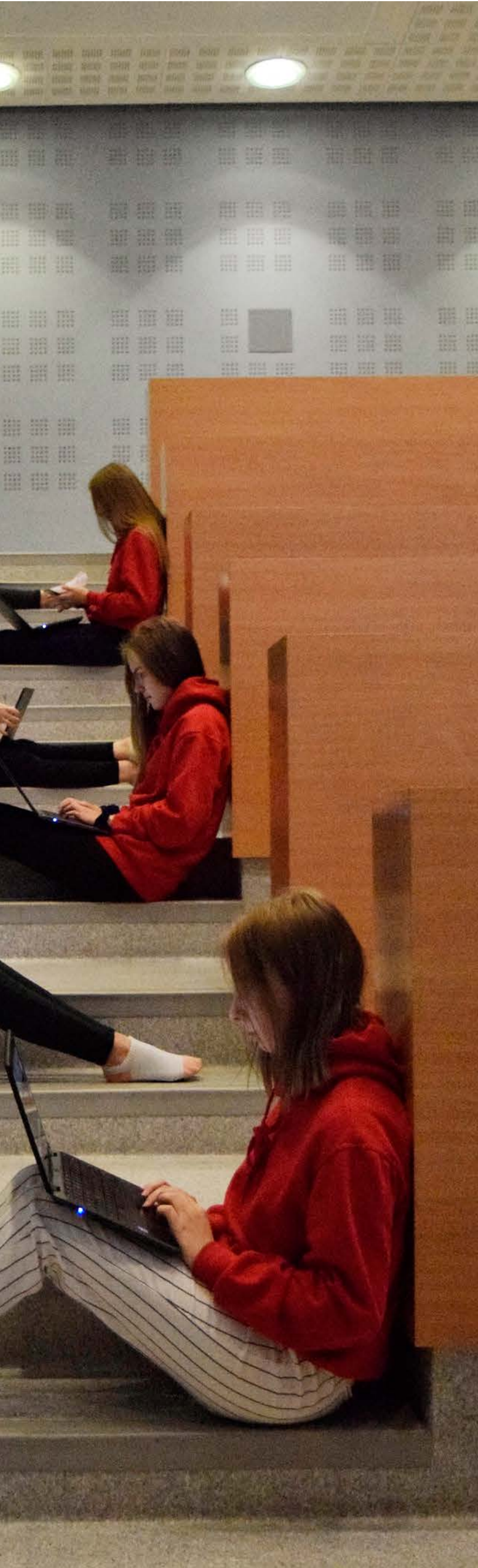
Ihminen on oma roolinsa messuorganisaatiossa. Kaikkia tarvitaan.